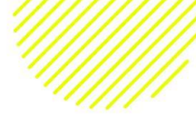
Actividades relacionadas con Chagas (en valores reales)