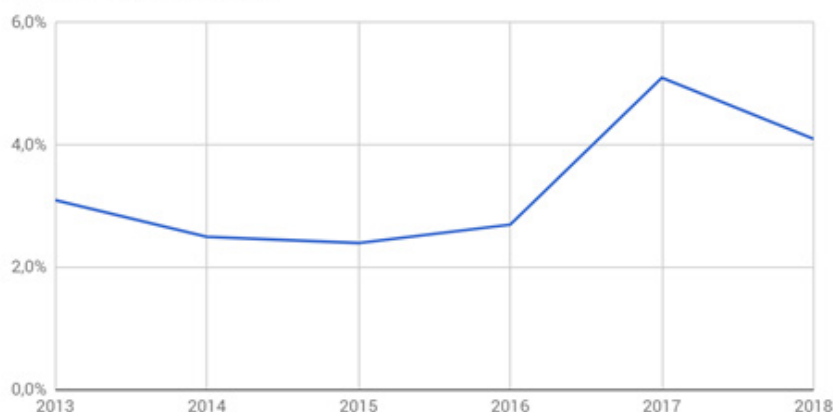
Porcentaje del Presupuesto de la Ciudad destinado a Vivienda 2013-Proyecto 2018